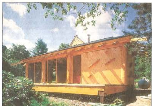
I PRO RODINU. V domě pro jednoho může po malé přestavbě bydlět i rodina s dětmi.