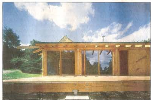
TEPLO I V ZIMĚ. Chladných měsíců není třeba se obávat. Dřevěná stavba je zateplena silnou vrstvou izolace.

Protože dům stojí na polosamotě hned vedle hájovny, kterou obývá investorovi rodiče, nemusela se řešit zahrada, garáž ani oplocení. Bezpečnost je zajištěna téměř středověkým způsobem. Obydlí mladého sportovce je totiž volně přístupné pouze přes vstupní terasu. Z ostatních stran je chrání strmý svah, potok a štítová stěna hájovny. Velká okna mají navíc bezpečnostní fólii a sousední objekt hlídají psi. „Stavba tohoto domku dokazuje, že do komfortního bydlení není nutné investovat přeměřené sumy. Stačí, když se k němu přistupuje kreativně a s láskou,“ dodává architekt Tomáš Klanc. Lenka Krejcarová