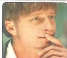
Michal Dlouhý herec

Za zcela ideální bydlení pro sebe považují to bydlení, které je moje. To může být byt, barák, stan, místo pod mostem, pod širým nebem nebo jiná kuca. Prostě se musí jednat o něco, co patří jen mně a nikomu jinému. Tedy co se týče mých nároků na bydlení, potřebuji mít hlavně pocit soukromí, a tedy místo na světě, na které mám (po dobu svého života) zcela výsadní právo. To, jak se v něm zařídím a zabydlím, je pak už otázka momentálního rozpoložení a naladění mé duše a samozřejmě také materiální situace. Důležité je, abych se ve svém domově cítil svobodně, šťastně a abych se tam mohl utíkat skryt před dnešním světem, když už nemám sílu postavit se mu na veřejnosti.