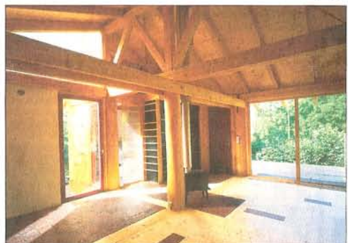
JAKO SKLÁDANKA. Interiér pojatý jako volný prostor dává obyvatelům možnost přizpůsobit domov aktuálním potřebám.