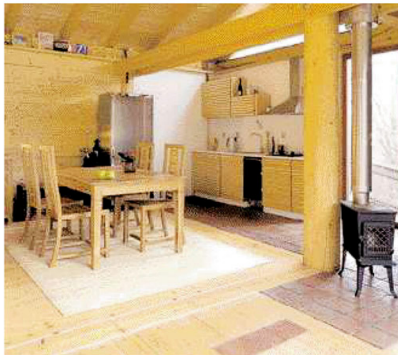
Společenským centrem domu je obývací část propojená s kuchyní.

Při stavbě se šťastně sešel investor s představou o bydlení otevřenou originálními myšlenkami a mladý architekt, kterého lze v tomto případě tak nazývat spíše ze setrvačnosti a proto, ▶