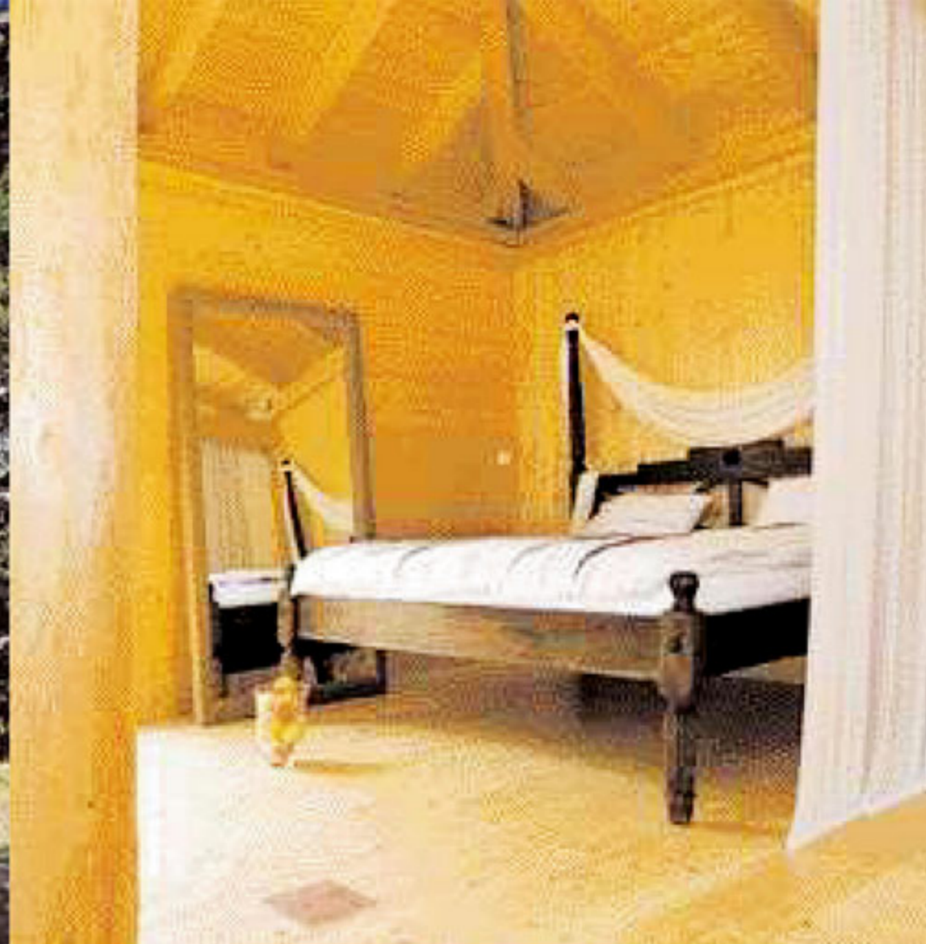
Intimní prostor ložnice lze oddělit závěsy.