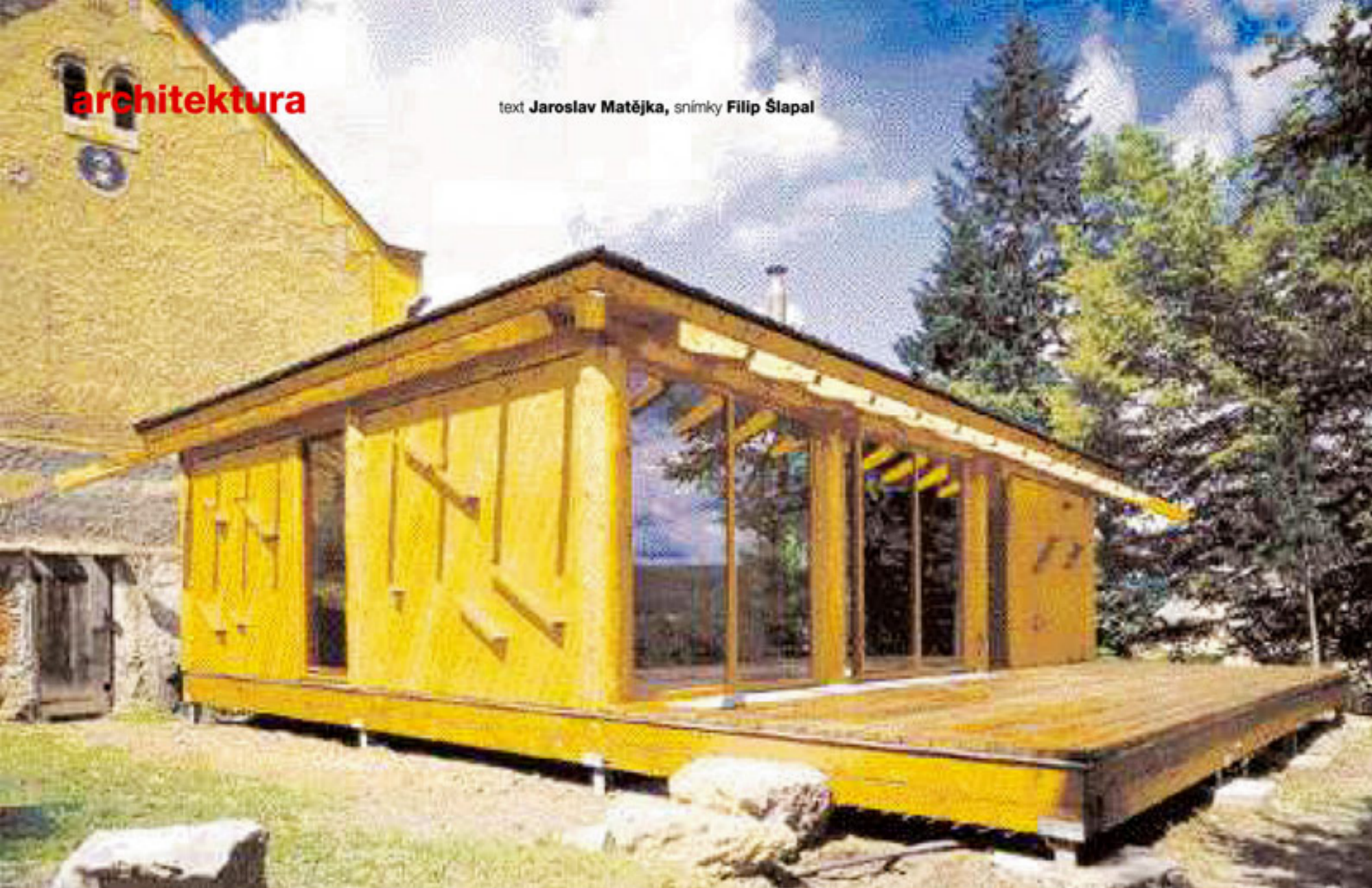
Na první pohled chata skrývá rodinný dům o velikosti běžného bytu 3+1.