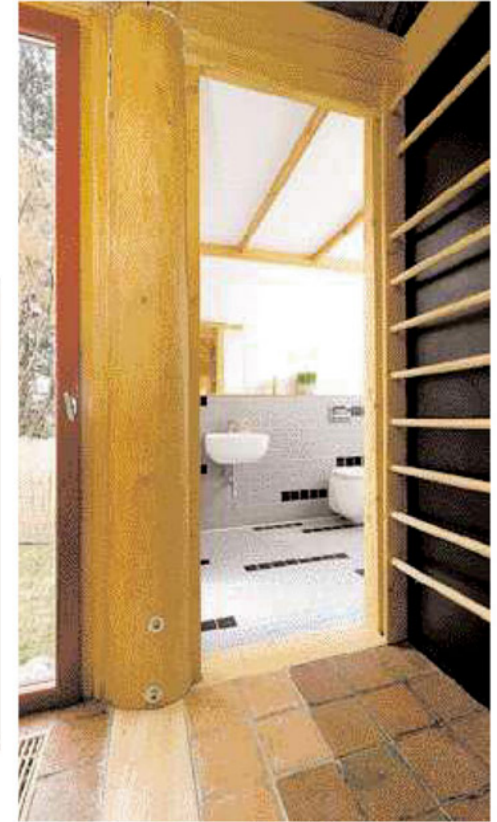
Koupelna je řešena jako jedna velká sprcha.