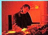
Blue, Soil live, Hoffbe, ZKAAT live, Ash