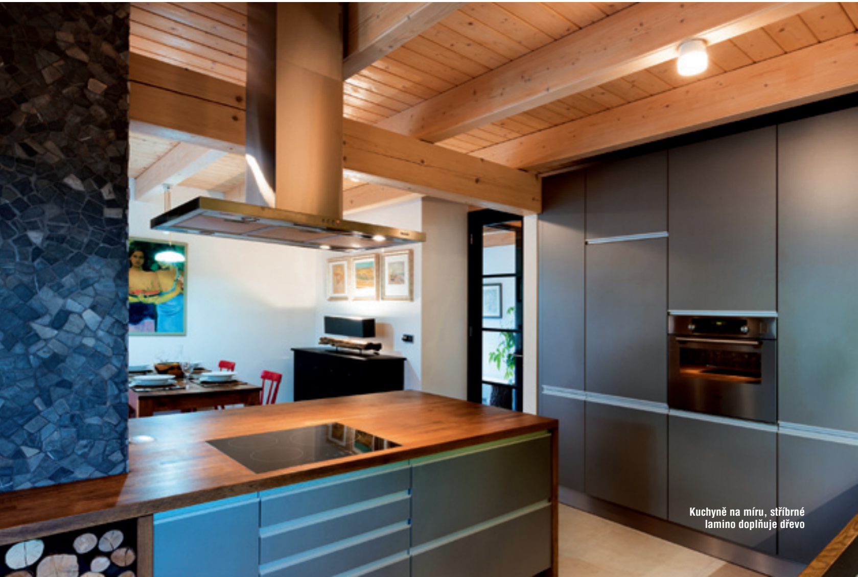
Kuchyně na míru, stříbrné lamino doplňuje dřevo