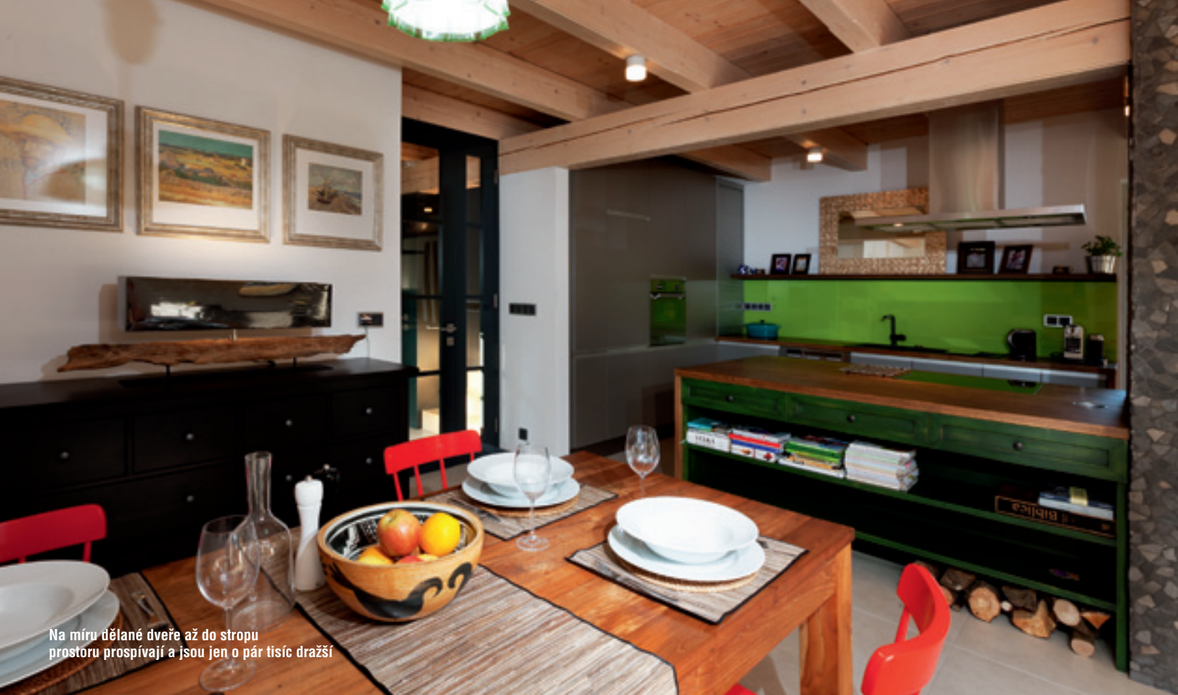
Na míru dělané dveře až do stropu prostoru prospívají a jsou jen o pár tisíc dražší