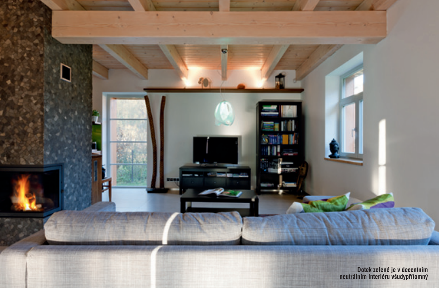
Dotek zelené je v decentním neutrálním interiéru všudypřítomný