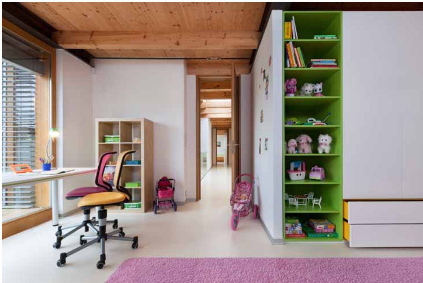
Koupelna vedle hlavní ložnice nabízí zajímavé odkládací plochy také pohled na střechy domů.

hluboké zásuvky, která probíhá středem ostrůvku. Barevnost sem vnáší také modrá pohovka, kterou navrhl Ivan Kroupa a je umístěná v jídelní části, i pestré koberce z Afghánistánu nebo Mexika a samozřejmě výtvarné objekty, obrazy a sochy. Jako atraktivní skulptury působí také úsporné lampy značky M.O.M, které za tmy krásně rozptylují světlo. Zajímavě jsou řešené obě koupelny, tu první ozvláštňují asymetrické odkládací plochy okolo vany, druhou pak výrazný duhový dekor na podlaze, seskládaný do polokruhu z barevné mozaiky, která v prostoru vyniká v kontrastu s černými stěnami natřenými omyvatelným nátěrem. Protože v té době ještě nebyla taková nabídka jako dnes, vznikla většina kusů nábytku také podle architekta návrhu, jak nízké stoly v obývacím pokoji, tak jídelní