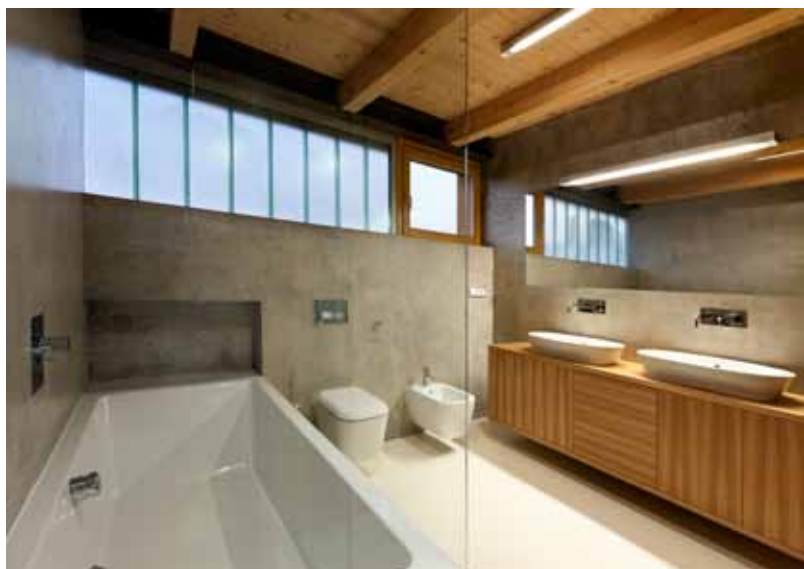
Pohled od kuchyně. Vlevo vpředu vyniká svítidlo Buddha (M.O.M).

na město. Ale nejen odpoledne a navečer, i ráno a dopoledne bývá interiér krásně prosvětlený také východními protilehlými okny u sezení s televizí a nad schody, které vedou o podlaží níž do ateliéru. Před nedávnem se z něj stalo bydlení pro syna se samostatným vchodem. Byty jsou ale stále propojené, i když schodiště je možné oddělit od podkrovní posuvnými dveřmi. Hlavním obytným prostorem, otevřeným do krovu, s propojeným obývacím pokojem, jídelní částí a kuchyní, prostupují dva komíny, jeden využívají pro krb, z druhého vznikla vysoká oboustranná knihovna. Na kuchyň navazuje ložnice spojená s kou-