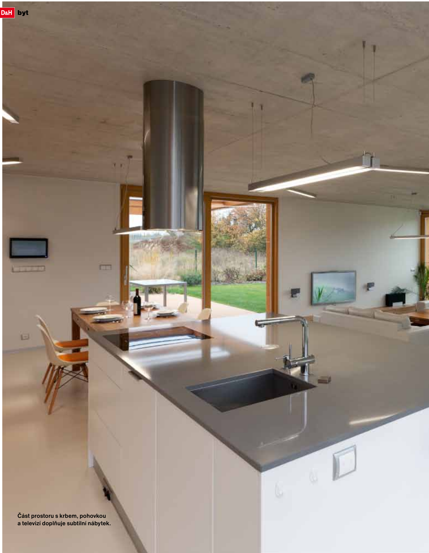
Část prostoru s krbem, pohovkou a televizi doplňuje subtilní nábytek.